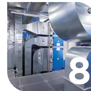
Lüftungs- und Klimatechnik