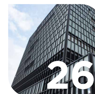
Multitec und Service Center Nationale Projekte