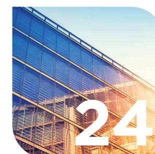
Facility & Property Management